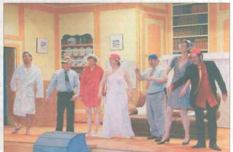
Tout est bien qui finit bien... mais en rap!